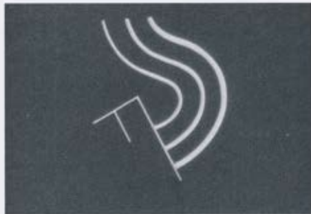
Viking Eggeling (Sivtjód / Sweden 1880–1925 Þýskaland / Germany) Stíllur úr kvikmynd / Stills from film Diagonal Symphony, 1921