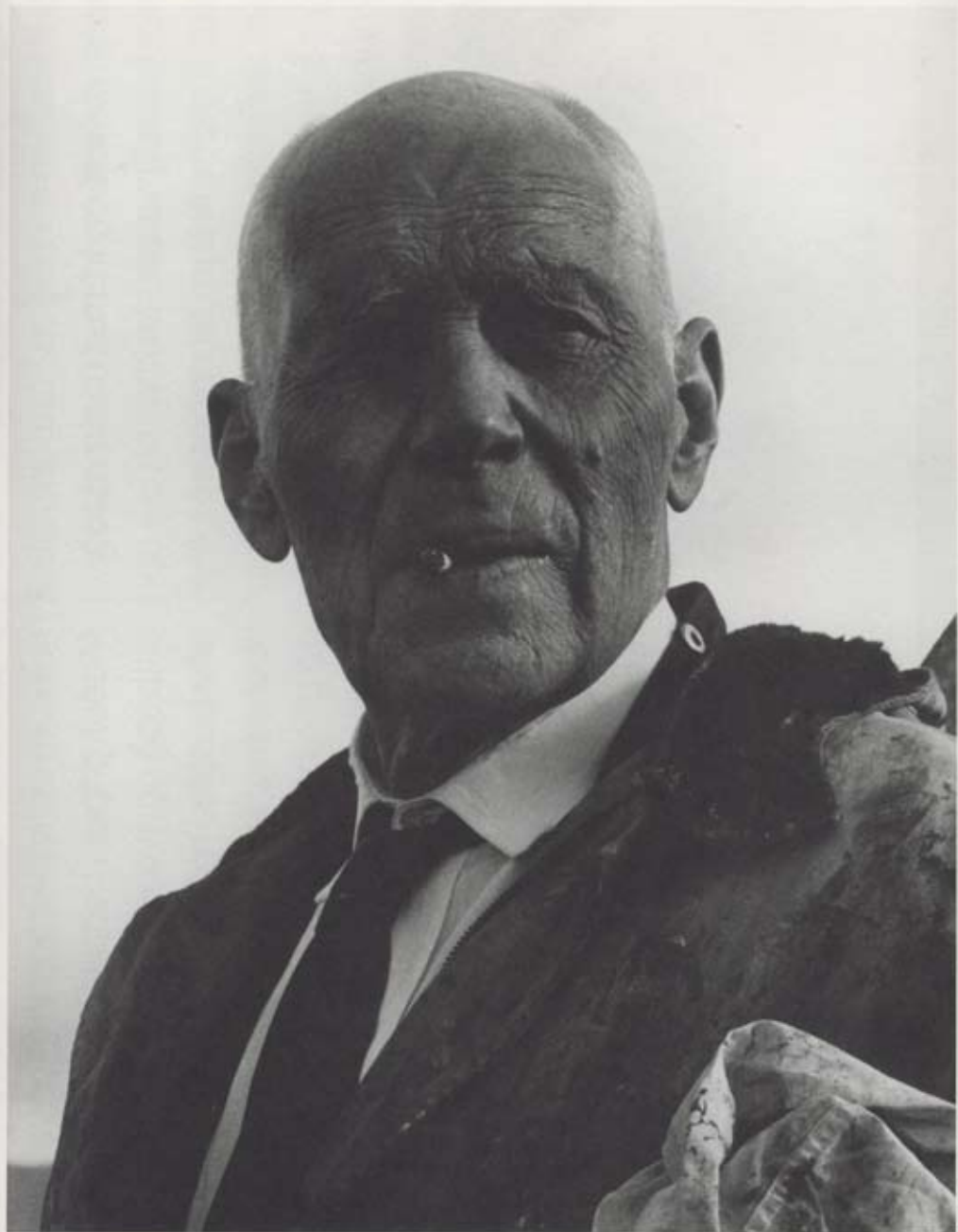
Jóhannes S. Kjarval – Ljósmynd / Photograph: Kristján Magnússon, 1963