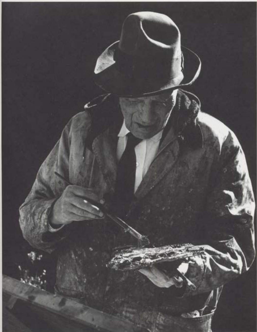
Jóhannes S. Kjarval