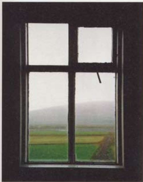
First Window, 1992