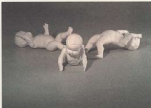
Anna Eyjólfssdóttir: Gulur fugl, 2003-4