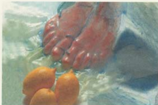
Ragnhildur Stefánsdóttir: Skápur, 2004 (hluti)