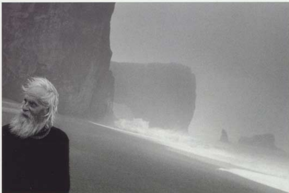
RAX: Bondi á suðurströnd Íslands, 1996

Til skamms tíma hefur landslagshefðin verið hvað ríkust í verkum sjálfstæðra ljósmyndara á Íslandi, og kemur ekki á óvart, þar sem náttúran er hér margslungin og fólkið fátt. Í fátæklegri flóru ljósmyndabóka á Íslandi hefur landslagsljósmyndin blómstrað á áhrifamikinn hátt. Fjölbreytileiki í myndefni og efnistöfum hefur engu síður aukist verulega á síðustu áratugum. Myndavélinni hefur í auknum mæli verið beint að samfélaginu, verkum manna og þætti þeirra í umhverfinu. Hin mannlega upplifun, tilbúin eða raunveruleg, hefur verið spegluð á margbreytilegan hátt.