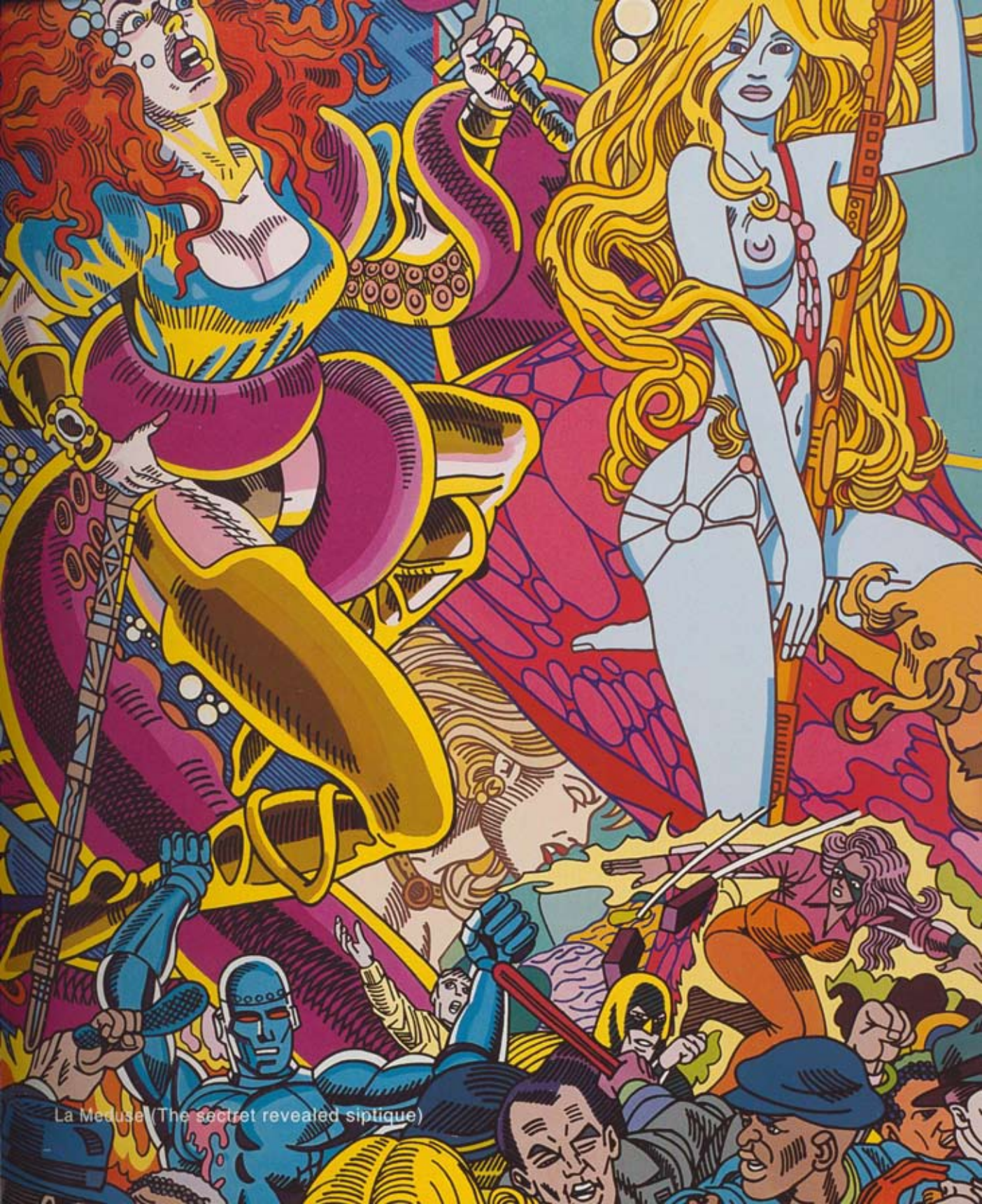
La Meduse (The secret revealed sliptique)