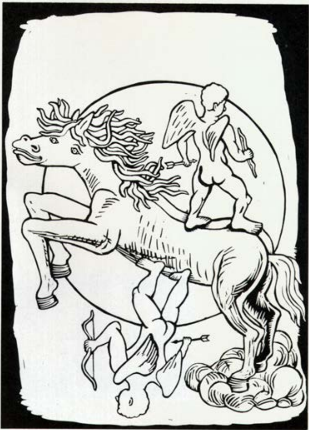
Hvíti hesturinn, 1987, dúkskurður, 30,5x42 cm