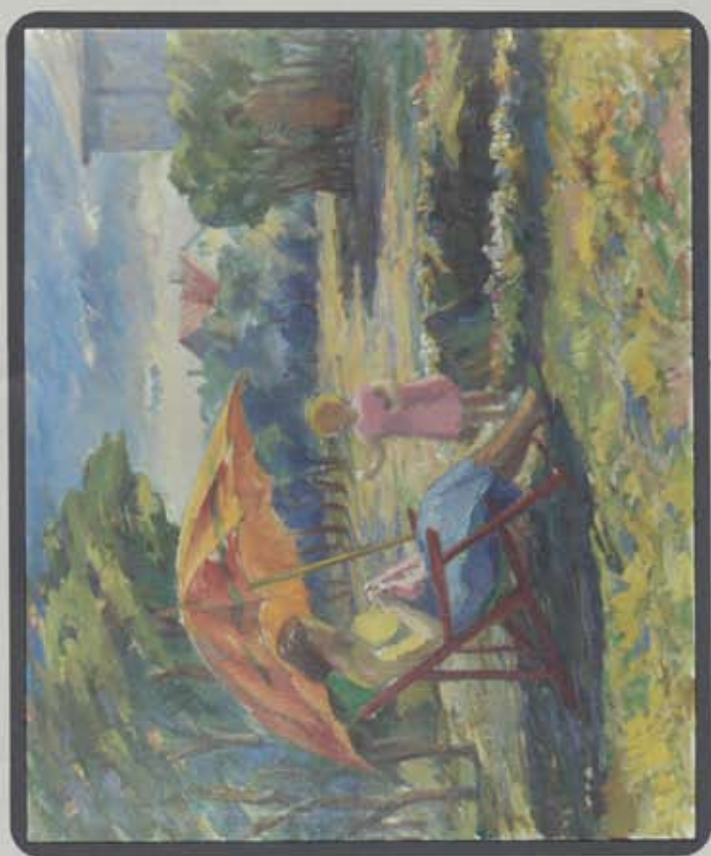
I GARDI 1952