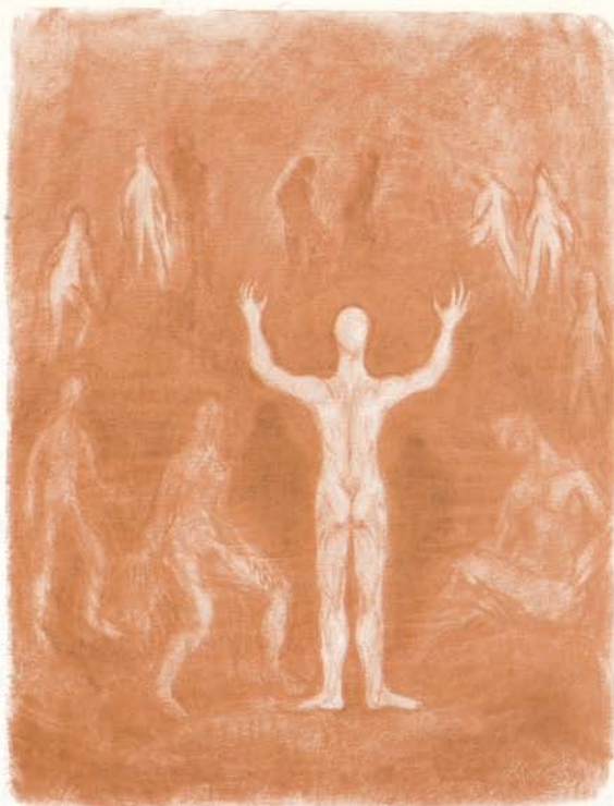
Fantasía 28,5x21,5 Rauðkrít