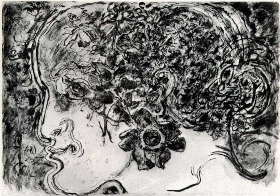
Blómandlit 35,5x40,5 Svart blek