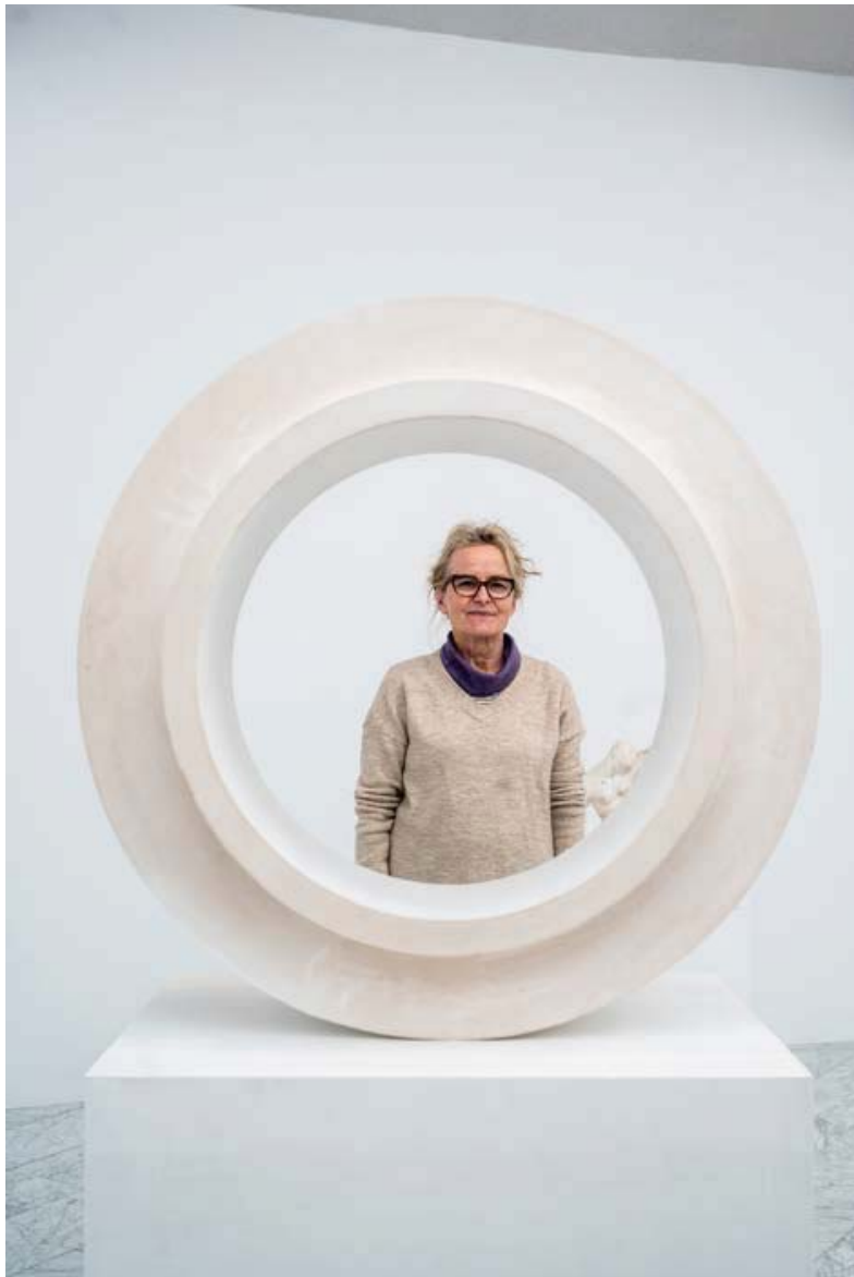
Verk Rósu á sýningunni eru úr gífsi.

Við undirbúning sýningarinnar gerði Rósa módel af sýningarsölunum tveimur þar sem verk hennar eru sýnd. „Þannig var auðveldara að vinna verkin í réttum skala. Þegar maður býr til sýningu eins og þessa þar sem verk manns eru til sýnis ásamt verkum annars listamanns þá verður maður um leið að skapa heildarmynd. Það er ekki hægt að