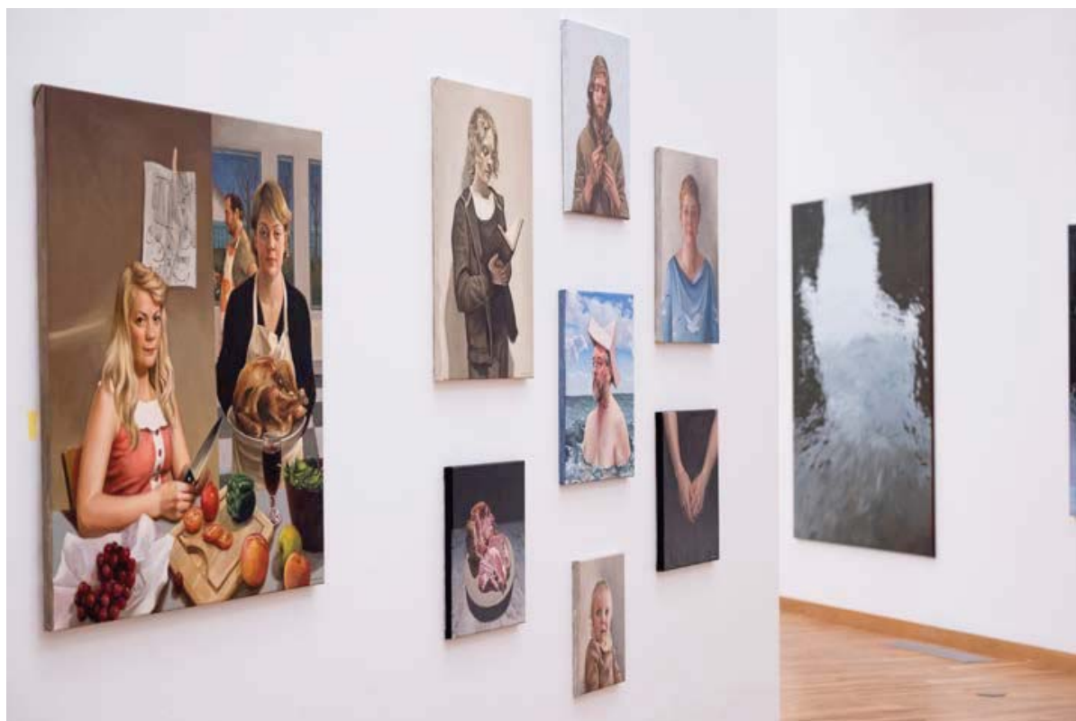
Séð yfir hluta salarins á Kjarvalsstöðum.

LISTAMENN ERU AÐ NOTA RAUNSAEID TIL AÐ SKILJA UMhverfi SITT EN LíKA SJÁLFA SIG OG MÁLA Það SEM STENDUR ÞEIM NÆRRI.