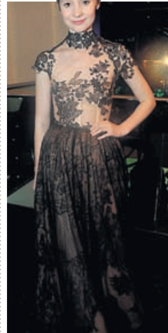
STUTT KLIPPT LÍSA Leikkonan Mia Wasikowska, sem leikur aðalhlutverk í Lísu í Undralandi var glæsileg á frumsýningunni í London.