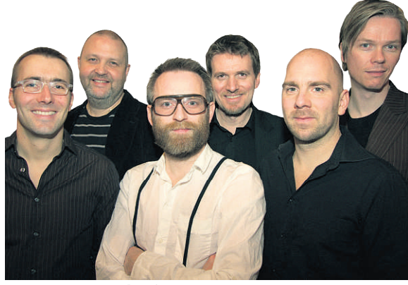
Mezzoforte eru á leiðinni til Vestmannaeyja.

Platan á að koma út í byrjun næsta árs, en þá verða fimm ár liðin frá því að sveitin sendi síðast frá sér efni. „Við erum nú ekki að breyta neitt um stefnu, en við erum komnir með nýja meðlimi,“ seg-