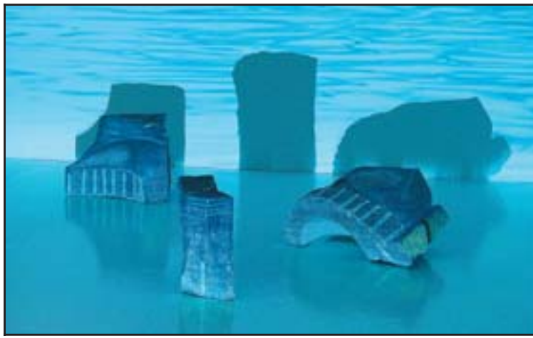
Lífræna – vélræna eftir Einar Mór Guðvarðarson.

Allitarlegur texti í sýningarskrá með ljóðrænum vangaveltum Einars leikur ekki minna hlutverk en verkin sjálf í að koma koma hugsun hans á framfæri. Má þar sjá margar