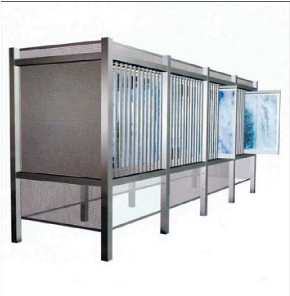
Verk Rúriar, „Archive – endangered waters“, byggir á gagnvirkri fjöltækni, en áhorfandinn getur dregið myndir af fossum út úr rekkanum og hlustað á nið þeirra um leið.

Ef við lítum til framvindunnar í þínum ferli er augljóst að þér hafa alltaf fylgt mjög sterk höfundareinkenni. Finnst þér sjóndeildarhringurinn í þinni sköpun hafa vikkað með aldrinum eða ef til vill frekar skerpst á þrengra sviði?