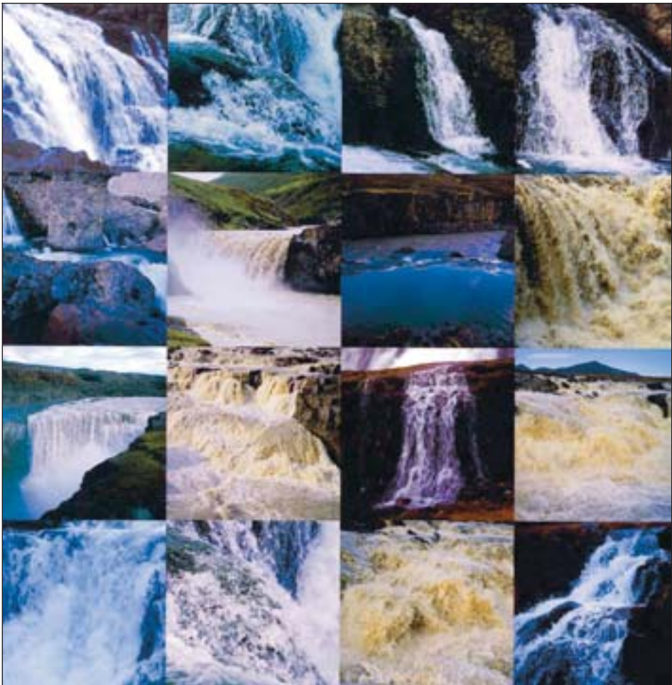
Smámyndir af hluta þeirra fossa sem eru í verkinu á tvíæringnum. Alls eru í verkinu ljósmyndir af filmu af 52 fossom sem komið er fyrir á milli glerja á rennibrautum sem rennt er inn í hirslu.