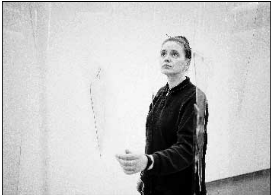
Listakonan Rúri sýnir verkið Glerregn.