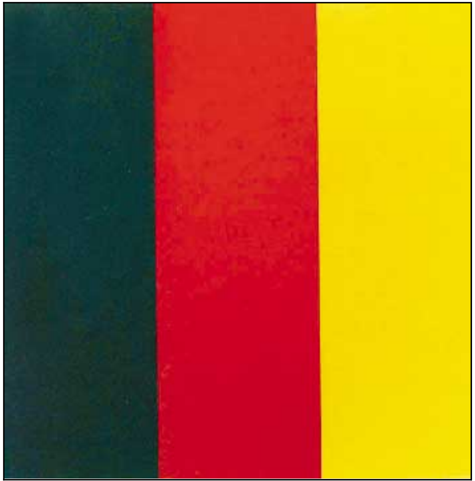
Svart, Rautt, Gyllt, 1999.

Til þess að forðast af náinn skyldleika við fána þýska sambandsríkisins ákvað Richter að gera fletina þrjá úr glertöflum sem málað var aftan á, og varð sú útfærsla að veruleika árið 1999. Á meðan verið var að velja liti og prófa mismunandi skiptingu flatanna urðu til smærri klippimyndir og verk unnin á gler, og er verkið sem hér sést dæmi um hið síðarnefnda. Á ferningsforminu, sem er útgangspunktur uppbyggilegrar myndgerðar, kemur tvíraðni myndefnisins enn betur fram: Það má lýsa því sem reglulegri þrískiptingu myndflatarins, þar sem hver þriðjungur er þakinn einum lit. Útkoman verður hvorki samhverf skipan né jafnvægi litanna; að vísu eru andstæðurnar rauður-svartur algengar, en hinn málmkenndi gulllitur gengur þvert á bæði litaandstæðurnar og samhljóminn. Þar sem litirnir tengjast ekki í samsetningu verksins myndar sléttur og jafngerður myndflötur glerbaksmálverksins, þar sem meira að segja vitneskjan um hina sögulegu merkingu litanna hrökklast burt, myndræna einingu. Litirnir virka því jafnmikilvægir, eins og þeir væru leiddir fram einn í einu, en um leið horft á þá sem mynd. Svart, rautt, gyllt minnir á veflistarmyndir Palermos, þar sem sú aðferð að skeyta saman lituðum efnisbútum opnaði honum leið til að komast frá táknaðni myndsamsetningu og fyrirbærafræðilegri samsetningu litamálverksins á sjöunda áratugnum.“