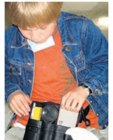
SPENNANDI SAFNABELTI Það kostar ekkert að fá lánað belti í einhverju af söfnunum þremur, Ásmundarsafni, Kjarvalsstöðum og Hafnarhúsi.