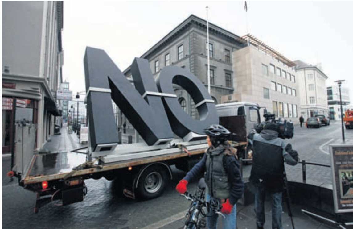
NO Gjörningur Sierra í aðdraganda sýningar hans í Hafnarhúsi vakti athygli. „Gjörningar hans eru undantekningarlaust hárbeyttir,” segir gagnrýnandi Fréttablaðsins.

Sýning Sierra í Hafnarhúsi er yfirlitssýning á verkum hans í formi kvikmynda, um fimmtíu talsins, en hver um sig er heimild um gjörning sem listamaðurinn hefur unnið með hjálp launaðs aðstoðarfólks. Gjörningarnir eru undantekningarlaust hárbeyttir og sjónrænir þættir leika stórt hlutverk í útfærslunni, gjarn-