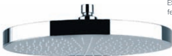
SPRING sturtuhaus kringlóttur 20 cm verð kr. 9.450.-