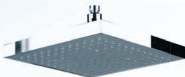
ESPRITE CARRÉ ferkantaður 20 cm verð kr. 12.400.-