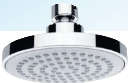
EMOTION sturtuhaus kringlóttur 10 cm verð kr. 3.990.-