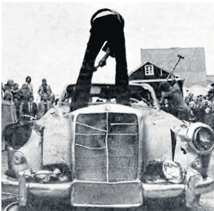
Róttæk Rúri mólvar drossfuna.

Rúri hefur hlotið fjölda viðurkenninga á ferlinum, m.a. var hún fulltrúi Íslands á Fenevátværingnum árið 2003, var valin borgarlistamaður Reykjavíkur 2005 og í ár var hún sæmd riddarakrossi hinnar íslensku fálkaorðu.