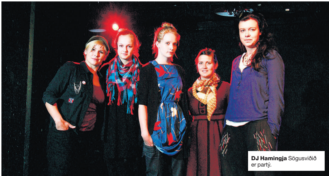
DJ Hamingja Sögusviðið er party.