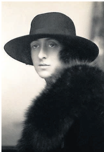
Ást Vita Sackville-West átti í sambandi við Virginíu Woolf.