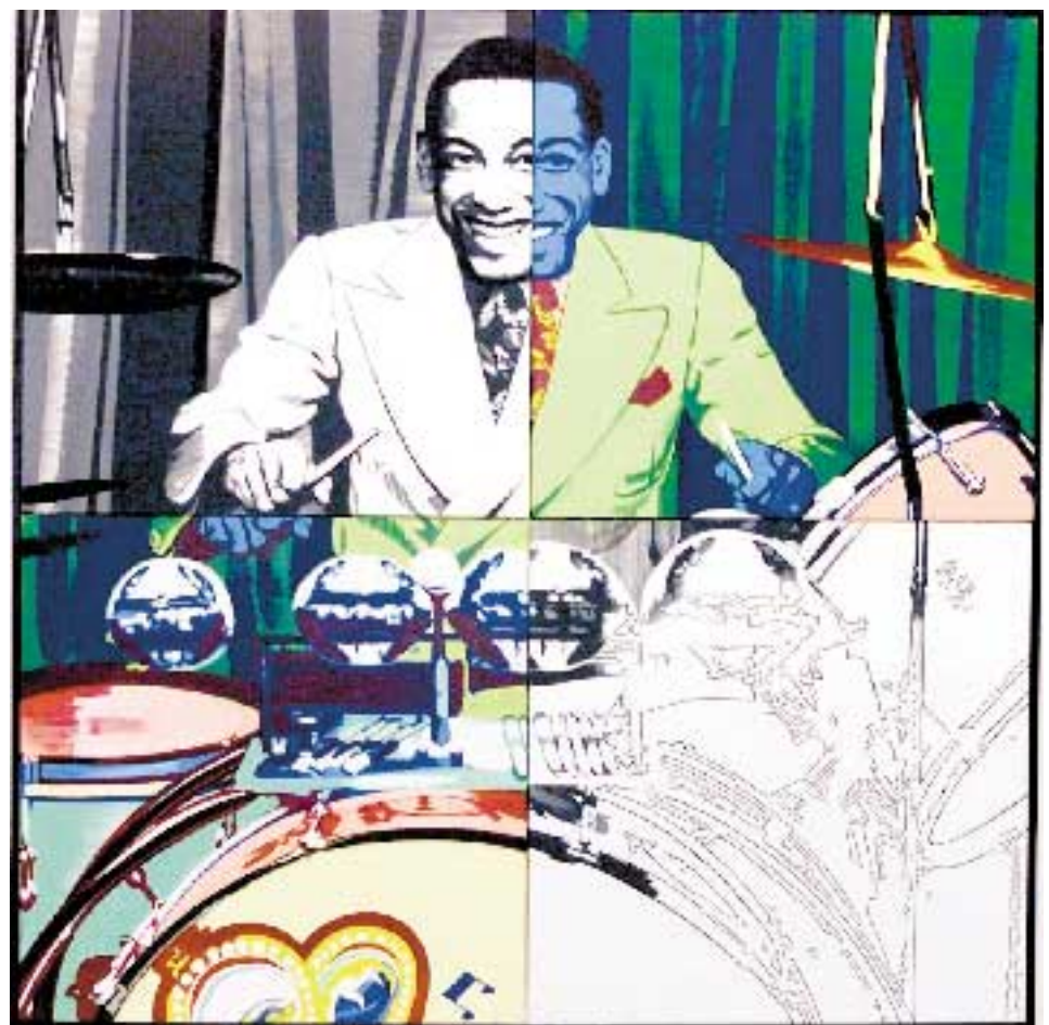
Bernard Rancillac: Chick Webb, 1997.

Í kynningu frá Listasafni Reykjavíkur segir m.a. um myndefni, tækni og samnefnara listamannanna frönsku: „Í sköpunarferli