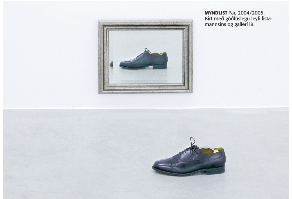
MYNDLIST Par, 2004/2005. Birt með góðfúslegu leyfi listamannsins og gallerí i8.