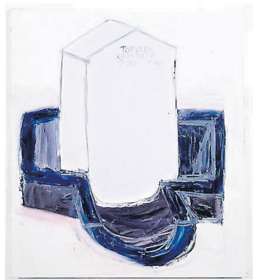
Andersson Svona málar hann leiðið.