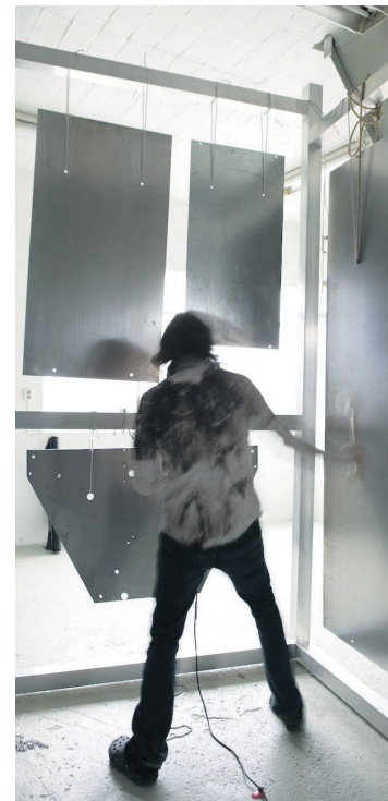
Efing Hljóðheimur hljóðfærins kannaður fyrir Þýskalandserföð.