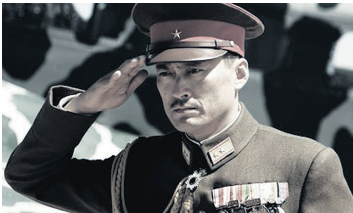
Hershöfðinginn Ken Watanabe fer með hlutverk Tadamichi Kuribayashi í Letters From Iwo Jima.