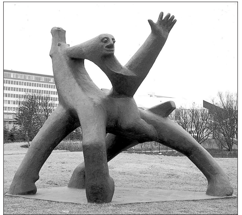
Helreiðin eftir Ásmund Sveinsson er í þremur útgáfum á sýningunni.