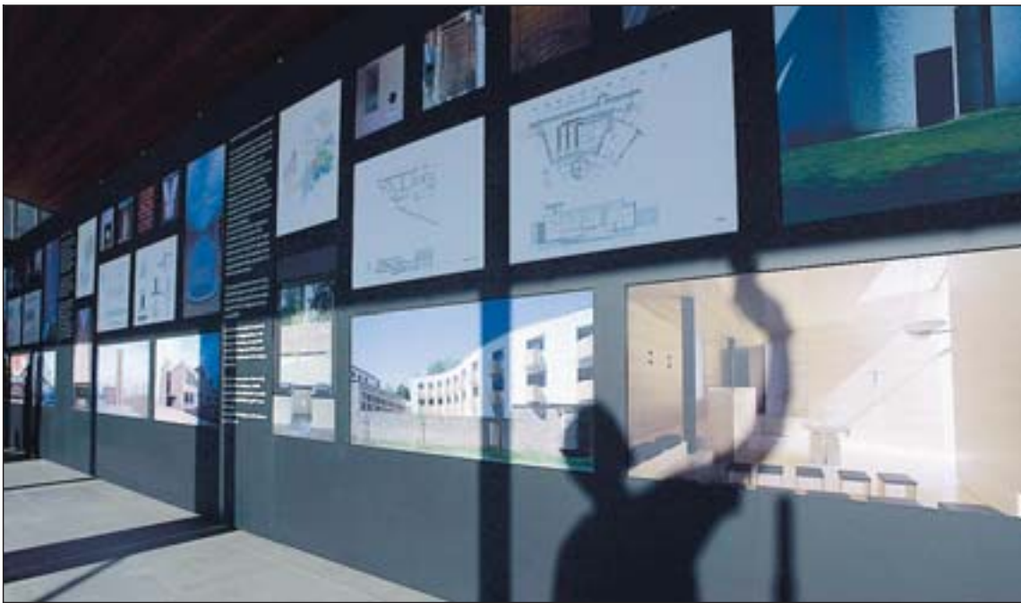
Yfirlitsmynd frá sýningunni Úti er ekki inni, inni er ekki úti á Kjarvalsstöðum.