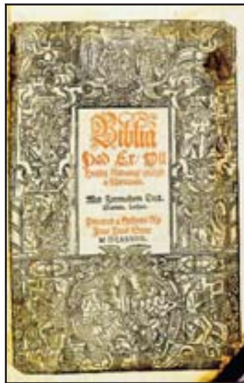
Saurblað Guðbrandsbiblíunnar sem seld var á uppboði Bruun og Rasmussen í Kaupmannahöfn í gær.