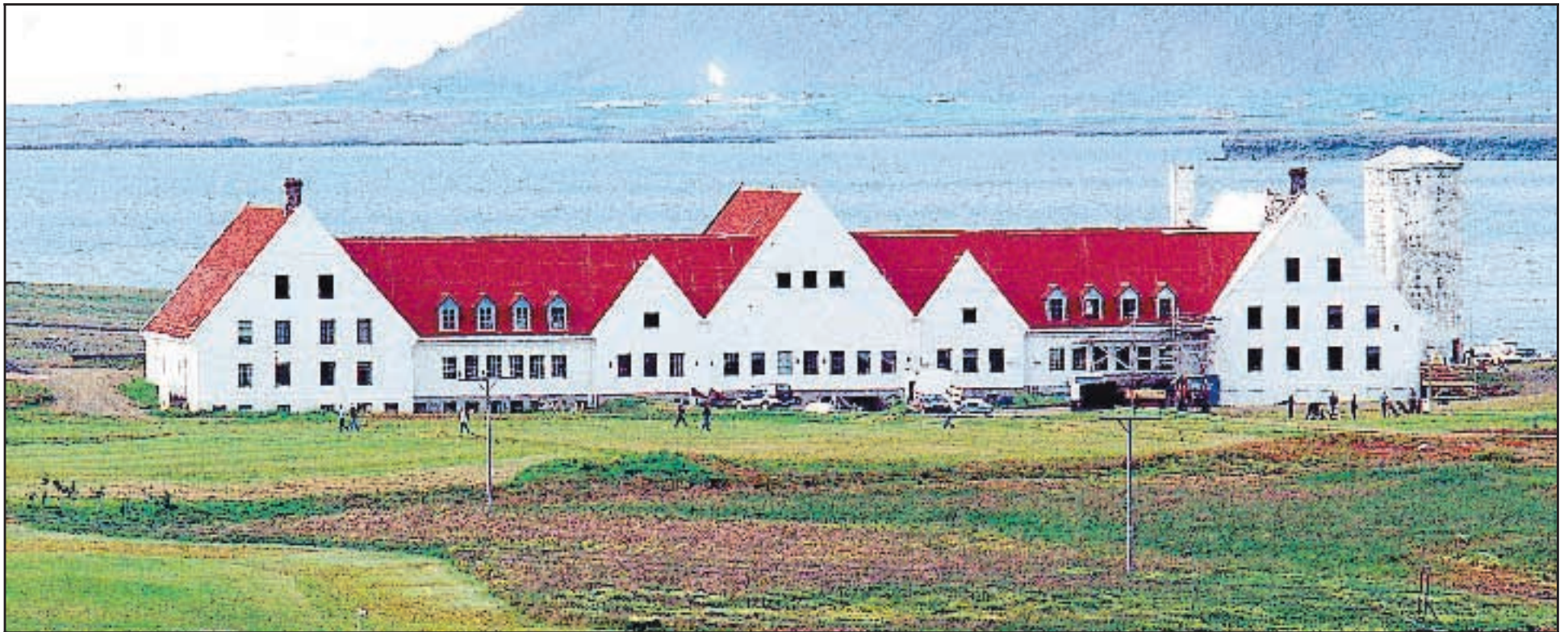
Í fyrstu hugdíst borgin byggja upp veglega listamiðstöð á Korpúlfsstöðum, þar sem Errósafnið yrði Kjarinn.

Aðsókn á sýningu Errós á Kjarvalsstöðum var með eindæmum góð og má segja að gjöfin hafi hleypt lífi í myndlistarumræðuna í landinu sem margir töldu einkennast af nokkurri ládeyðu. Fullkomið listaverkasafn, frá svo eftirsóttum og þekktum listamanni á alþjóðavísu, varð jafnframt mörgum listáhugamönnum tilefni til umræðna um ófullnægjandi tengsl íslensks myndlistarlífs við erlenda strauma og vona um að slík tengsl mættu styrkjast í kjölfar þessa viðburðar.