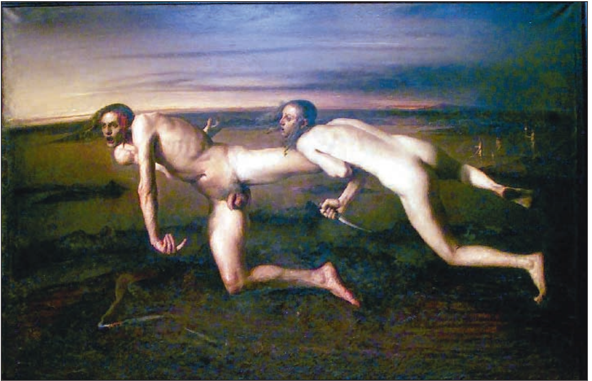
Kona drepur særðan mann, 1994. Eig. Astrup Fearnley Museet for Moderne Kunst, Ósló.