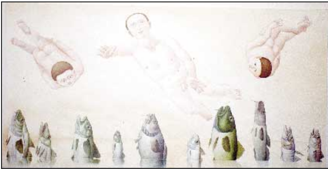
Helgi Þorgils Friðjónsson, Fiskar sjávarins, olía á striga, 2000.