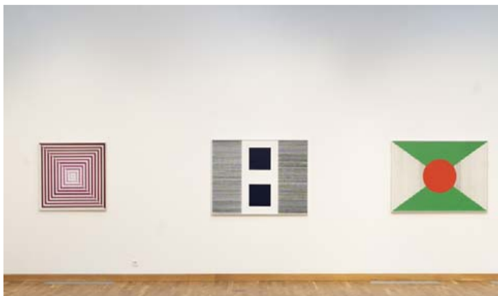
Allir listunnendur ættu að bregða sér á Kjarvalsstaði.

„Ef hún hefði lifað lengur finnst mér sennilegt að hún hefði reynt að vinna að fleiri verkefnum tengdum arkitektúr. Hún hafði mikinn áhuga á samvinnun myndlistar og arkitektúrs,“ segir Ingibjörg. „Hún gerði stígahandrið á kvennaheimilið á Hallveigarstöðum, óskaplega fallegt smíðajárnshandrið. Við vitum til að hún gerði tillögu að framhliðinni að