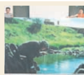
BÖRN NÁTTÚR-UNNAR Eftir Friðrik Þór Friðriksson.

Fjölmargir aðrir viðburðir eru tengdir sýningunni sem eru unnir í samstarfi við Alþjóðlega kvikmyndahátíð í Reykjavík og kvikmyndahátíðina Nordisk Panorama, sem báðar fara fram seinni hluta september.