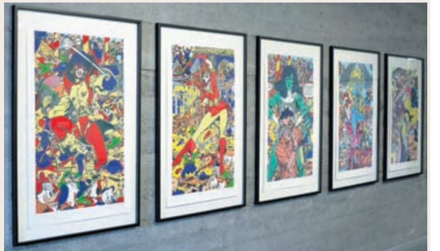
Á AFMÆLISSÝNINGUNNI Litskrúðugar myndir sem Erró vann fyrir sýningu í Gautaborg.