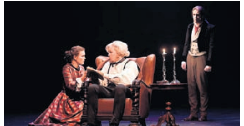
ÚR VESALINGUNUM Leikurinn í Vesalingunum einkennist af ofsahraða, segir í dómi Elísabetar Brekkan. Sagan um einstæðu móðurina, sem kom barninu sínu fyrir hjá groddalegum og gráðugum hjónum, meðan hún sjálf þrælaði fyrir því í verksmiðju og lenti svo á glapstigum vændisins, lendir í skugga ofuráherslunnar á hópsenur.

Leikhópurinn í heild sinni skilaði leikatriðum vel og mörg þeirra voru