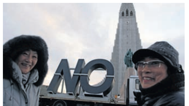
NEI! Gjörningur Santiago Sierra hefur vakið athygli vegfarenda í Reykjavík undanfarna daga.